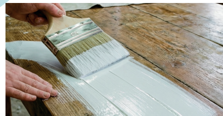
Для деревянных поверхностей